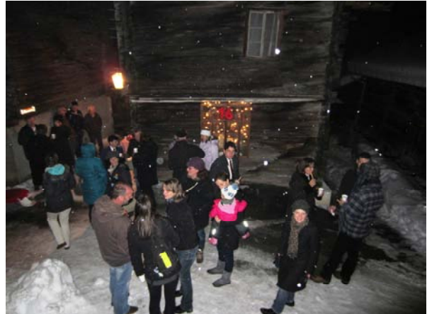
Viel gutgelauntes Volk bei der Öffnung des Adventsfensters