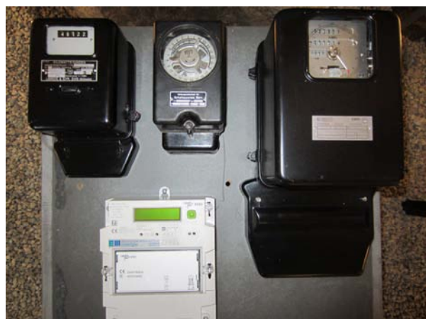
Zähler verschiedener Generationen, die in der Sonderausstellung gezeigt wurden.